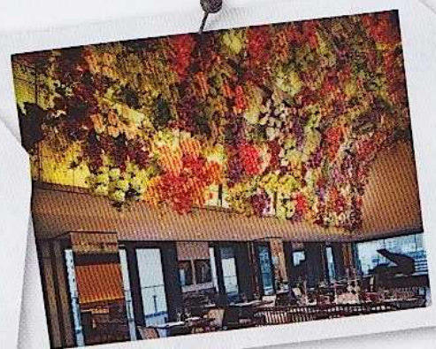
HONGKONG Im Restaurant „Sevva“ sind Interieur und Speisen gleichermaßen spektakulär

■ HOTEL Hotel Okura, 2-10-4 Toranomon, Minato-ku, Tokyo 105-0001, Japan, Tel. +81 3 35820111, www.hotelokura.co.jp „Ein seltenes Beispiel für japanisches Goer-Jahre-Design. Leider planen die Eigentümer, das Gebäude abzureißen und einen Hotelklotz zu errichten. Also: Jetzt hinfahren!“